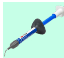
3M™ Filtek™ Supreme Flowable Restorative 6032 + teinte