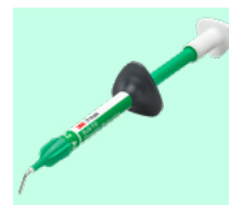
3M™ Filtek™ Bulk Fill Flowable Restorative 4861 + teinte

*Prix maximum conseillé chirurgien-dentiste TTC