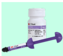
3M™ Filtek™ Easy Match Universal Restorative 6210B, 6210N, 6210W, 6220B, 6220N, 6220W