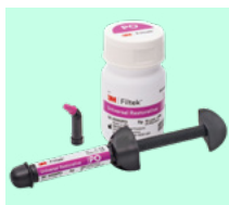
3M™ Filtek™ Universal Restorative 6550 + teinte, 6555 + teinte