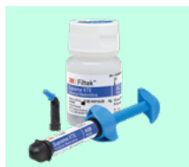
3M™ Filtek™ Supreme XTE Universel Restorative 4910 + teinte, 4911 + teinte

Les références des composites Filtek™ comprises dans la promotion :