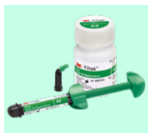
3M™ Filtek™ One Bulk Fill Restorative 4866 + teinte, 4867 + teinte